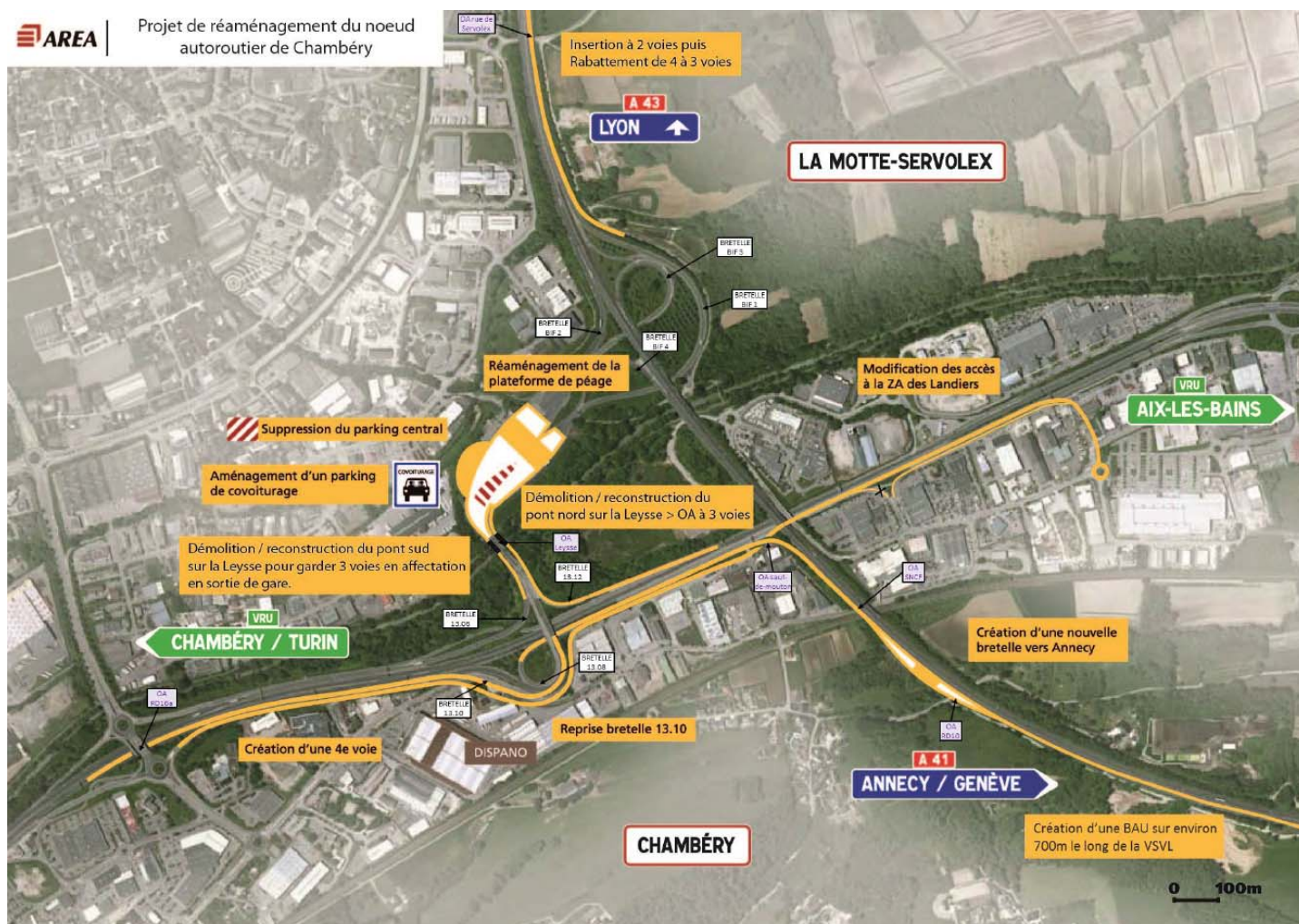
Figure 2 : Les principaux aménagements du projet. Le Nord est à droite (source : dossier)

L'ensemble des travaux, y compris ceux qui portent sur des parties non concédées, sera réalisé par Area. Ils concernent les communes de Chambéry, de La Motte-Servolex et de Voglans.